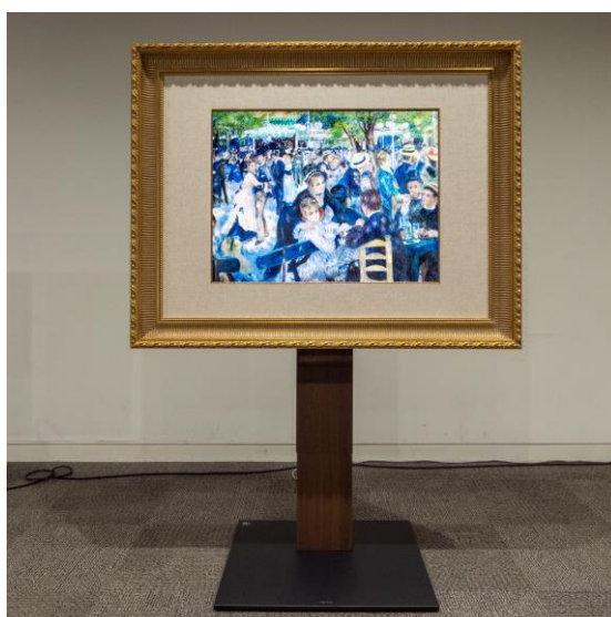
西洋絵画プランスタンド設置イメージ

※詳細はホームページにもございます、サービスの利用規約よりご確認ください。 https://www.ntt-arttechnology.com/arttechview/