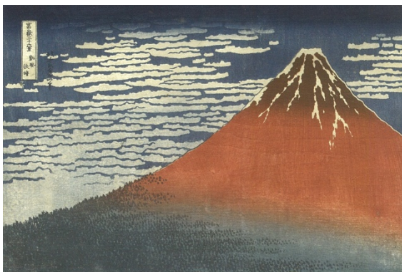
「富嶽三十六景 凱風快晴」

・1 枚 300 円、5 枚以上ご購入で 1 枚 200 円、「富嶽三十六景 全 47 枚セット」（箱・帯封済）4,700 円