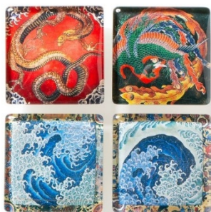
ガラスマグネット（男浪・女浪・龍・鳳凰）各660円