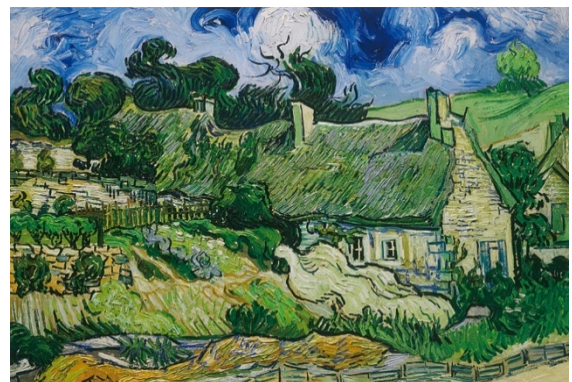
フィンセント・ファン・ゴッホ「コルドヴィルの藁葺きの家」