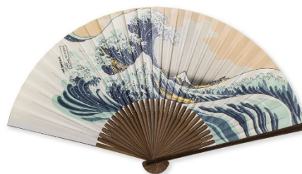
扇子（神奈川冲浪裏）2,650円