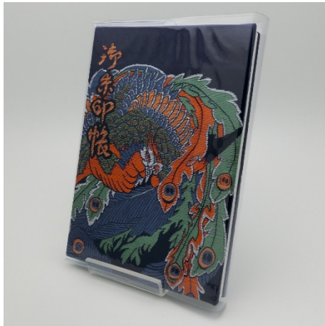
鳳凰図御朱印帳 2,000 円