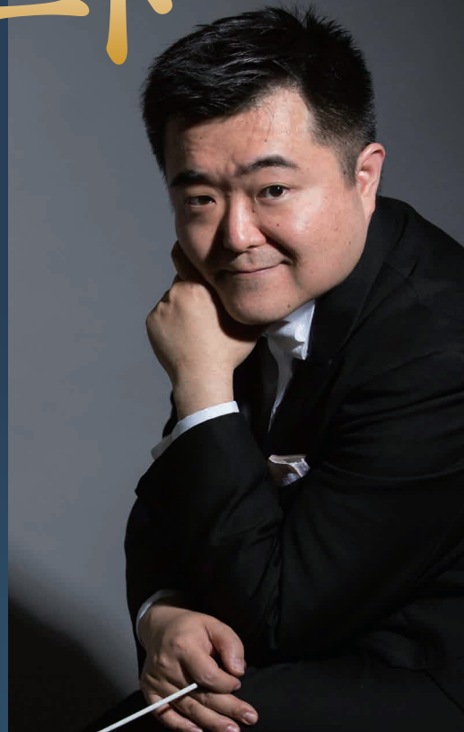
Ryuichiro Sonoda, conductor