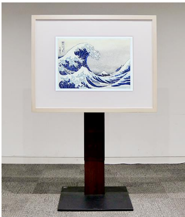
日本画プラン 55 インチ