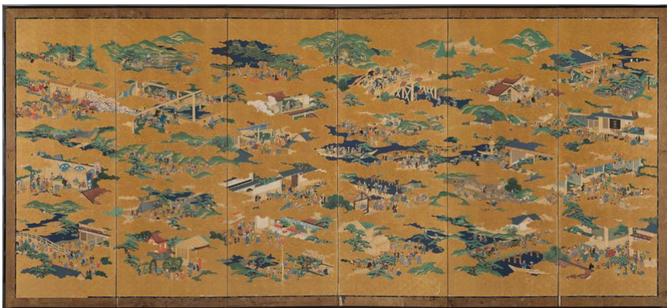
伊勢参宮名所図屏風