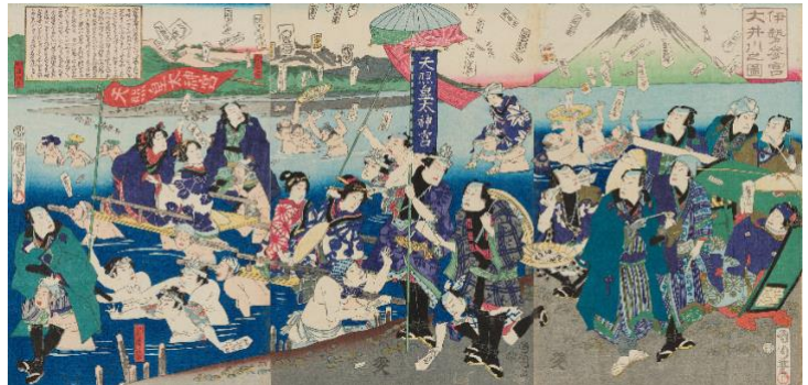
伊勢参宮大井川之図